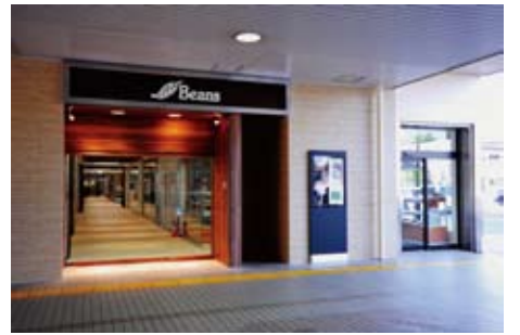
上／デジタルサイネージ 中／「お菓子アート」や「工芸菓子」を展示するアートウォール「Beans+」 下／外観 Beans入口